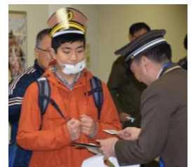
通しNo.付き「受講証明書」

※札幌市交通局 HP にも紹介されています。(市営交通> 交通局の取組み > 地下鉄・市電を安心して利用できるための取組み > 乗車マナー教室を開催しました)