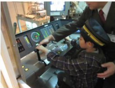
教官直伝の操作体験