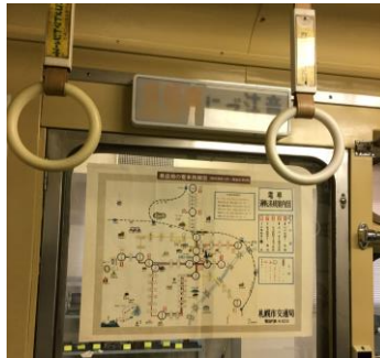
昔の市電の路線図や停車ブザーの音などにノスタルジーな親