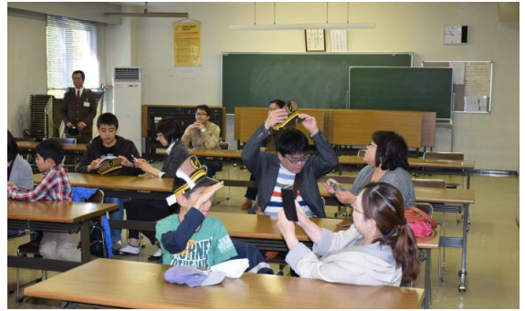
今年は車掌帽のクラフト作りも