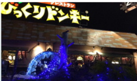
LIUB ひくくりドンキーひばいヶ丘店