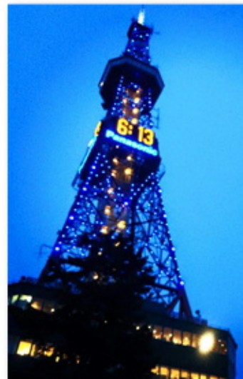
LIUB さっぽろテレビ塔