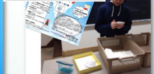
配布した啓発カード入りティッシュ作り