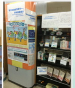
厚別図書館 関連図書コーナー