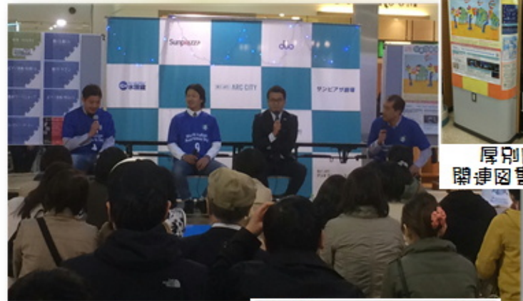
トークショー&サイン会