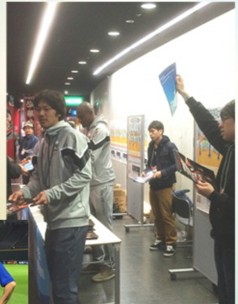
若手選手も応援に