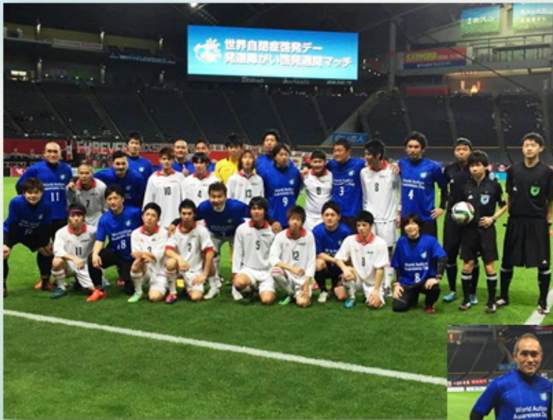
知的障害サッカー NFC vs コンサドーレOB