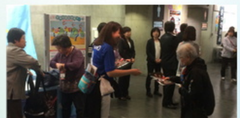
啓発×コンサドーレクリアファイルの配布