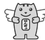
明るい選挙キャラクター 選挙のめいすいくん